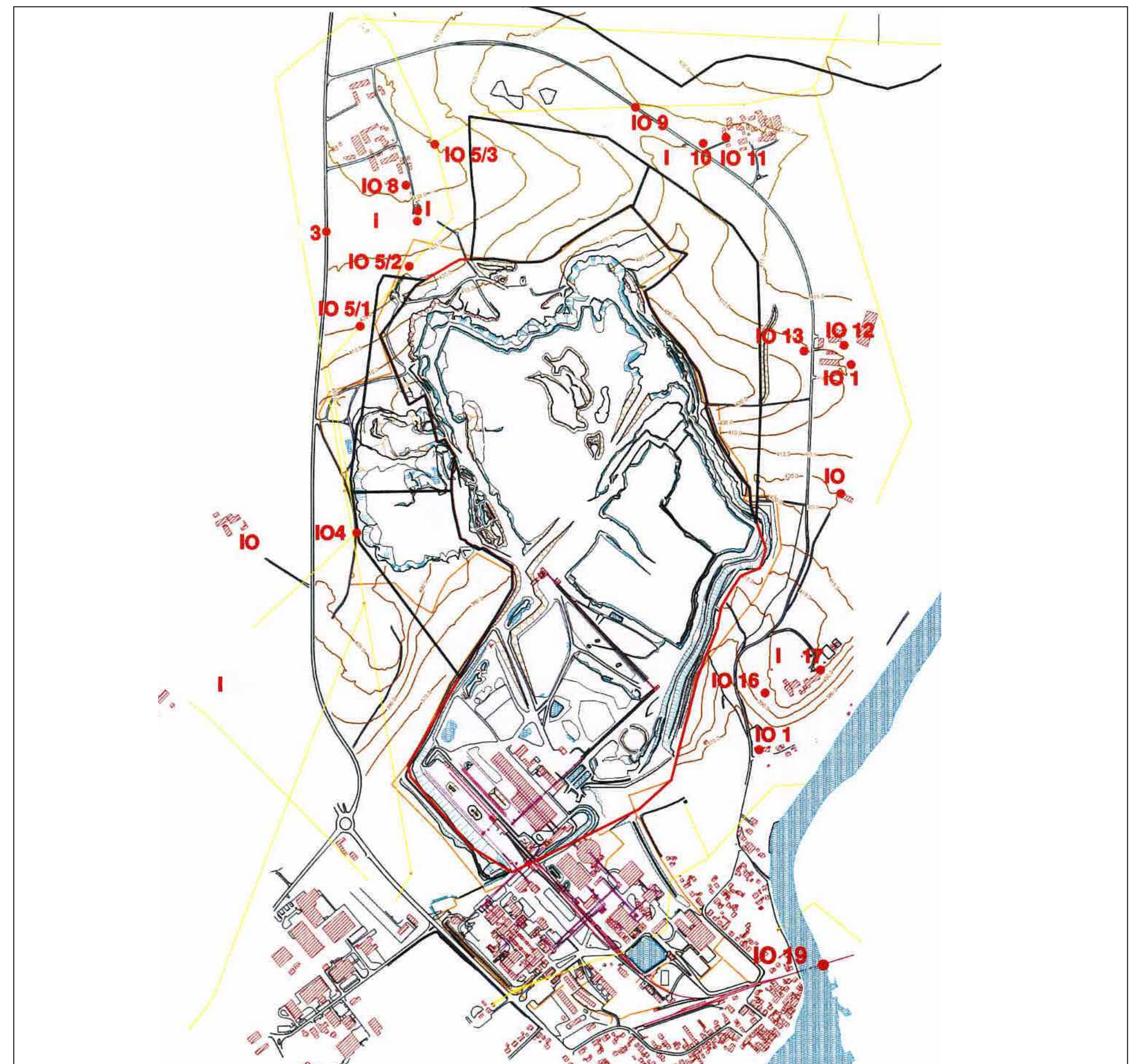
Untersuchte Wohnhäuser bzw. Immissionsorte

Der Sprengschall wird die maximale Lautstärke von 90 dB(A) an keinem Messpunkt (außerhalb der Genehmigungsgrenze) überschreiten. Zum Vergleich: ein Handschleifgerät erzeugt ca. 90 dB(A), ein Schuss aus einem Jagdgewehr ca. 130 dB(A).