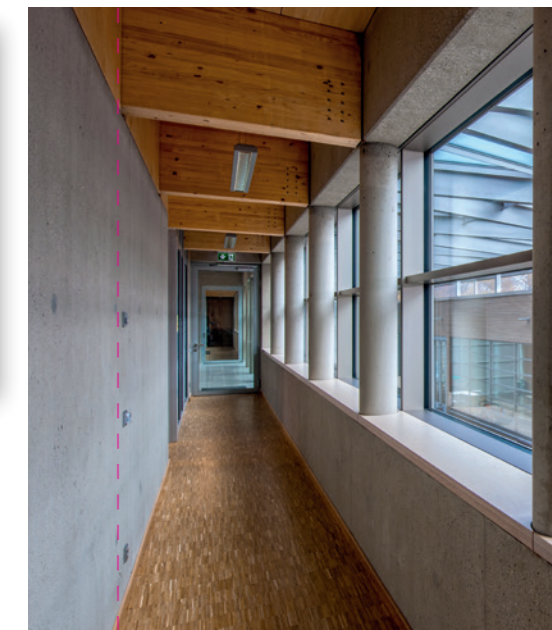
← Werftanlage Starnberg, Starnberg Claudia Schreiber Architektur und Stadtplanung GmbH, München