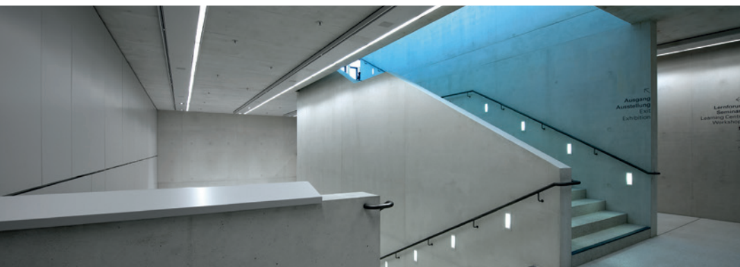
← NS Dokumentationszentrum, München GSW Georg Scheel Wetzlar Architekten, Berlin

Sichtbeton – DAS Designelement im modernen Bauwesen. Mit einer großen Farbvielfalt und unterschiedlichen Bearbeitungsmöglichkeiten der Betonoberfläche lassen sich Natürlichkeit und Lebendigkeit des Baustoffs Beton besonders betonen. Im Sichtbeton-Musterpark der Heidelberg Beton Gebiet München ist ein Musterpark eingerichtet, in dem zahlreiche Sicht- und Farbbetone ausgestellt sind.